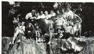
Jentekoret i Bryn på tur til Finland sommeren 1990.