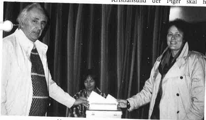
Noen stemte da ved M-råds-valget