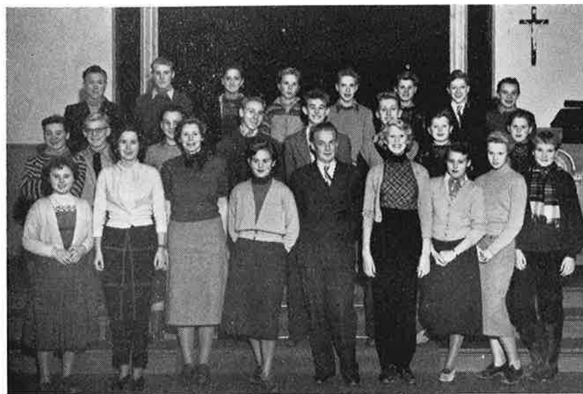
Konfirmanter i Bryn 6. desember 1953