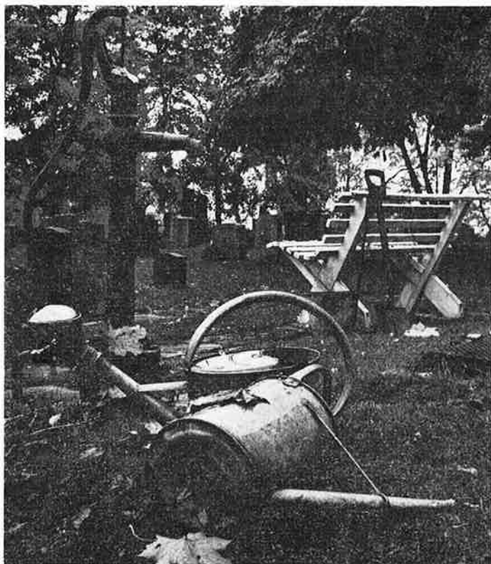
VANNPUMPEN PÅ TANUM KIRKEGÅRD