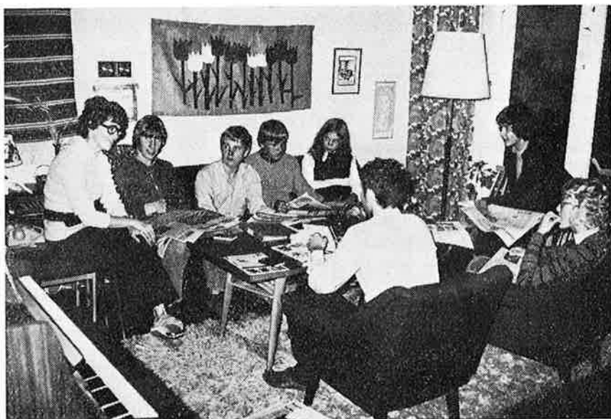
Konfirmantgrupper med to voksne ledere i private hjem diskuterer «ER JESUS AKTUELL?»