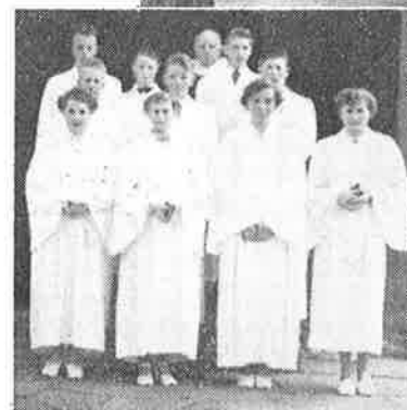
Konfirmantene i Tanum kirke.