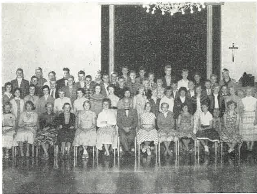
Her ser De konfirmantkullet høsten 1957.