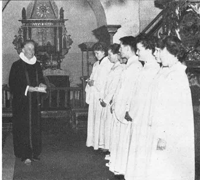
For første gang på mange, mange år ble det i høst holdt konfirmasjon i Tanum kirke.