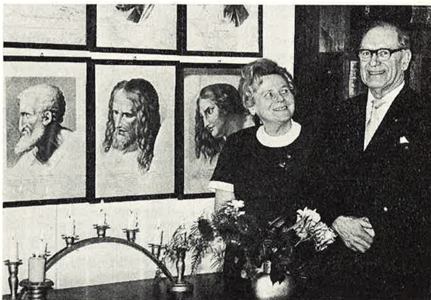
Presteparet fotografert i hallen i Evjebakken 23.

— I disse 14 år har menigheten hatt en rivende vekst — faktisk lagt på seg hele 18 000 personer. Klart at det har