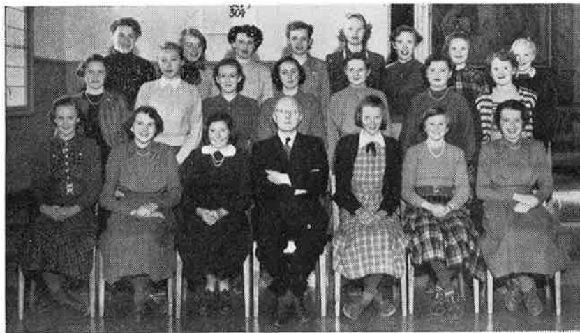
Konfirmantene i Vestre Bærum 10. mai 1953