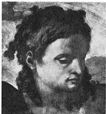
Michelangelo: Kristus (1536—1541) Sixtinske kapell.

Vår protestantiske oppdragelse gjør at vi lærer så meget om reformasjonen og så lite om motreformasjonen. Omtrent på den tiden da Luther skrev på sitt siste opprop, «Mot Pavekirken i Rom, innstiftet av djevelen», påtok den store florentinske billedhugger Michelangelo Buonarotti seg motvillig å male tarket i det Sixtinske kapell i Rom.